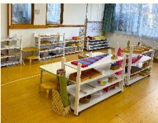
モンテッソーリ教室